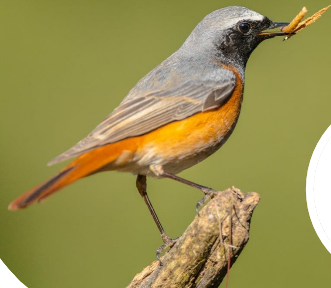
Nestkast roodstaart (Welkoop)