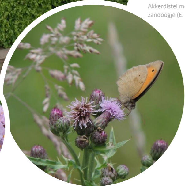
Akkerdistel met bruin zandoogje (E. Witter)