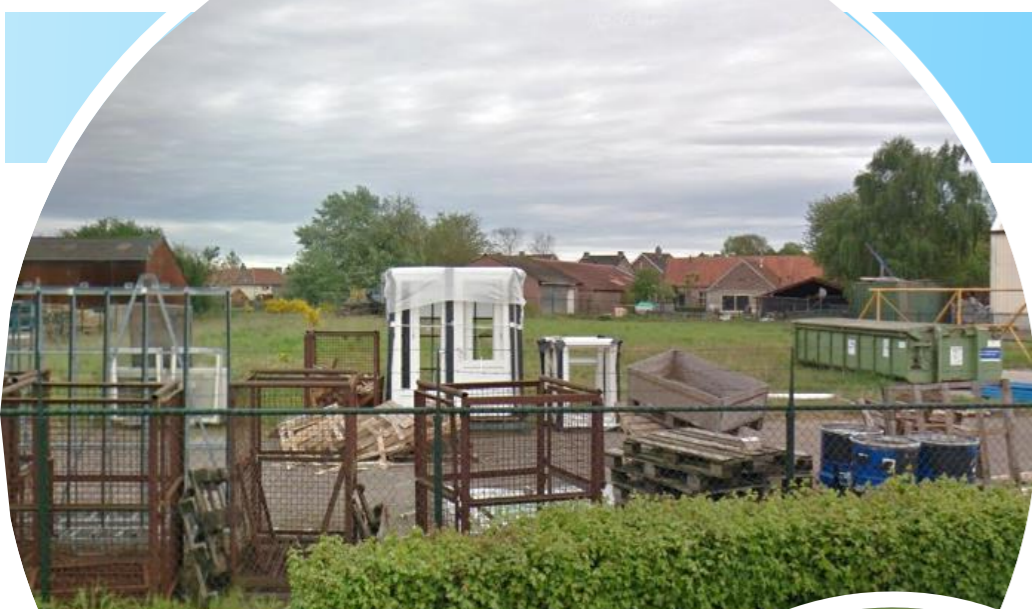
Braakliggend deel op het bedrijventerrein