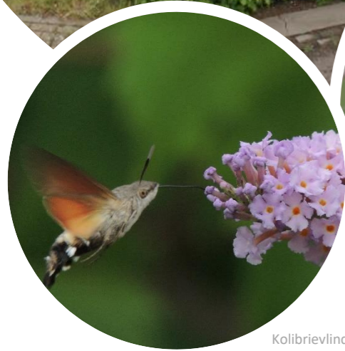
Kolibrievlinder (E. Witter)